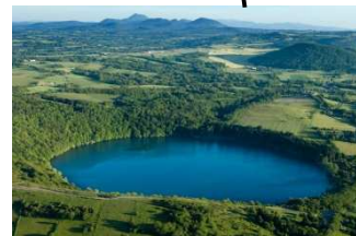
Gour de Tazenat