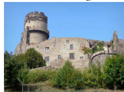
Château Tournœl (Volvic)