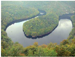
Méandre de Queuille