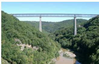
Les Fades, Barrage et Viaduc