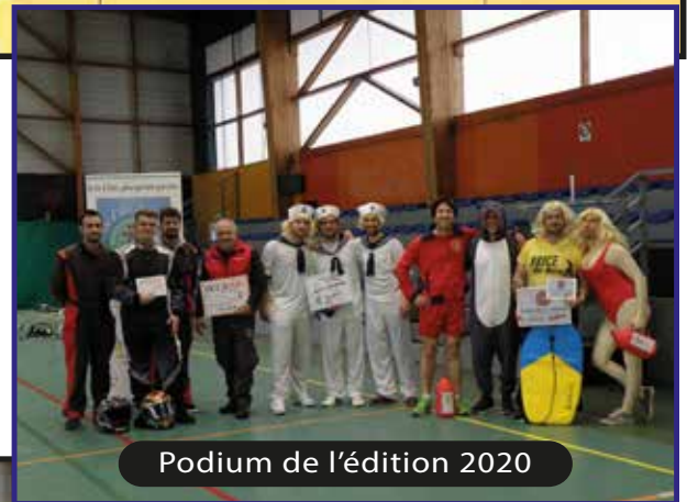
Podium de l'édition 2020