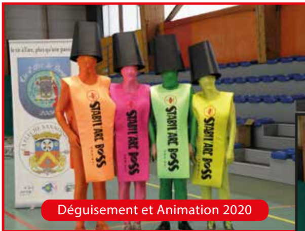
Déguisement et Animation 2020